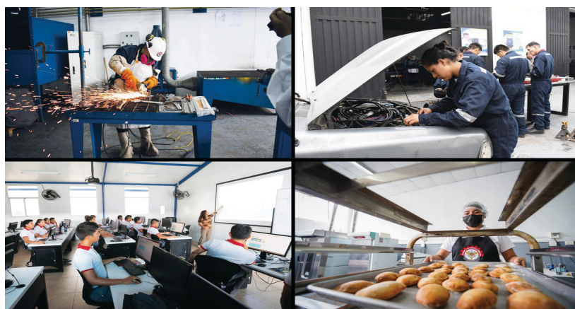
Desarrollo de los programas profesionales técnicos de Mantenimiento de Maquinaria, Mecánica Automotriz, Computación e Informática y Administración Hotelera

laboral y que impacten en la defensa y desarrollo nacional, puesto que sus egresados ayudan a reducir la brecha de personal técnico profesional en el país; asimismo, es consecuente con el rol estratégico del Comando Conjunto de las Fuerzas Armadas, de participar en el desarrollo nacional 5 , y con la Ley de la Marina de Guerra del Perú, que establece su participación en la ejecución de las políticas de Estado en materia de desarrollo económico y social del país 6 .