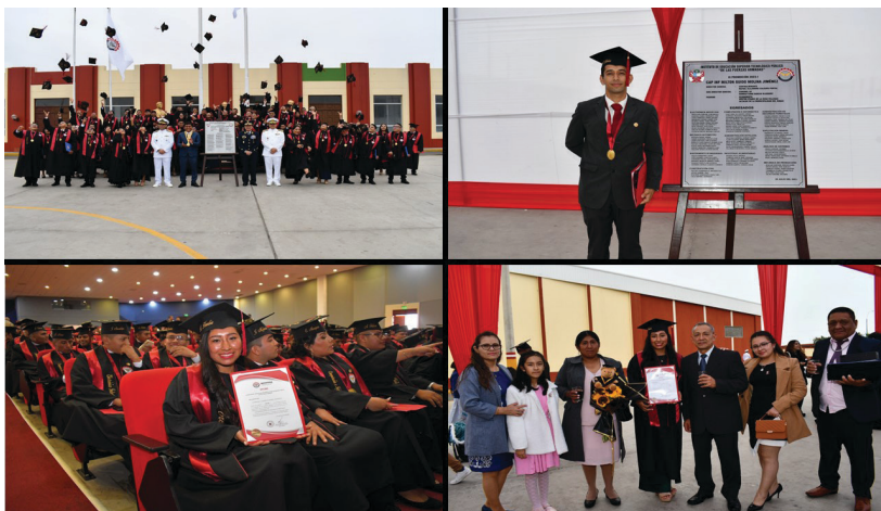
Ceremonia de egreso de la XI promoción periodo académico 2023-I

El perfil del egresado es de un profesional técnico competente y capaz, forjado en valores de honestidad, respeto, responsabilidad, solidaridad, integridad, trabajo en equipo y, lo más importante, el amor a la patria. Esta formación entrega a la sociedad profesionales con las competencias y capacidades que posibilitan su participación en el desarrollo de sus respectivas regiones, así como constituir una reserva altamente calificada para ser convocada en caso sea necesario. Con más de mil ochocientos egresados, las encuestas elaboradas durante el año 2023 7 a los jóvenes que realizan el servicio militar voluntario, arrojaron como resultado que, estudiar en el IESTPFFAA fue la segunda opción que influyó en su decisión de realizar el servicio militar voluntario; mientras que la primera fue ingresar a las diferentes escuelas de los institutos armados.