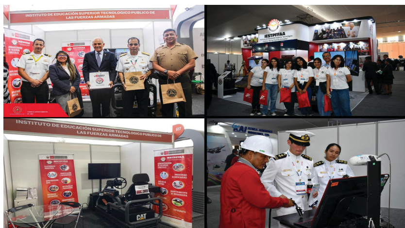
Participación en “PERUMIN 36 – Convención Minera”, “Exhibición Tecnológica y Minera (EXTEMIN)”, “SITDEF-2023” y “V Expo Cyber de Seguridad y Defensa 2023”

Siguiendo esa misma estela, para fomentar el bienestar social de la comunidad educativa y la empleabilidad de los estudiantes y egresados mediante la implementación de bolsa de trabajo, bolsa de prácticas pre-profesionales y emprendimientos, el IESTPFFAA ha participado el presente año en importantes convenciones y exposiciones, como el “IX Salón Internacional de Tecnología para la Defensa y Prevención de Desastres SITDEF-2023”, “V Expo Cyber de Seguridad y Defensa 2023”, “PERUMIN 36 – Convención Minera” y “Exhibición Tecnológica y Minera (EXTEMIN)”.