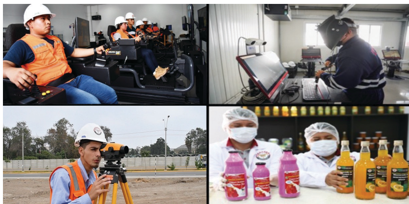
Desarrollo de los programas profesionales técnicos de Explotación Minera, Mecánica de Producción, Topografía e Industrias Alimentarias