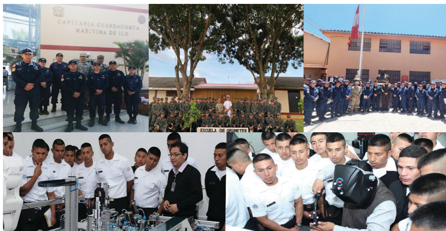
Difusión permanente en Lima y Provincias mediante visitas realizadas a dependencias navales, así como visitas a instalaciones del IESTPFFAA

Con relación al personal del servicio militar voluntario de procedencia naval, a la fecha de elaborado el presente artículo, suman 1686 los miembros del personal naval, entre cabos, marineros y grumetes en actividad o licenciados, que han postulado los últimos tres años a este centro de formación profesional técnica; lo que permite concluir que el personal de marinería toma como una opción de crecimiento personal y profesional al IESTPFFAA.